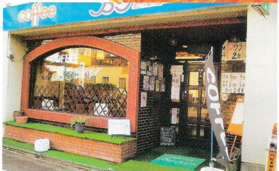
①種料理のメニューが多彩な喫茶店

通称「鉄板スパ」と呼ばれるメニューで知られる喫茶店。鉄板の上にオムレツ、その上にナポリタンスパゲティがのったイタリアン・スパゲティ650円などが人気だ。また、この店考案の鉄板で出す塩焼きそば650円もおすすめで、焼きそばの上にチーズがたっぷりのった塩チーズ焼きそばは680円。●名古屋市東区東大曾根町34-12 第二厚進マンション1階 ●JR・名鉄大曾根駅から徒歩8分 ●7~19時(日曜、祝日は8~17時) ●土曜 ●2台