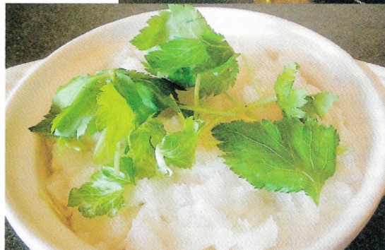
①大根おろしの入ったみぞれ鍋はさっぱりとした味わい

定番の味噌煮込みきしめんは、丸一日かけて仕込んだ八丁味噌スープを使い、深みのある味わいが好評。オススメは、11~3月までの期間限定のみぞれ鍋きしめん900円。この店でしか食べられない逸品で、きしめんにたっぷりの大根おろしをのせ土鍋で煮込んで食べる。1カ月熟成させた自家製のぼん酢との相性も抜群だ。●名古屋市東区徳川2-5-5 ●名鉄瀬戸線森下駅から徒歩5分 ●11時30分~14時30分、17時30分~20時30分 ●不定休 ●4台