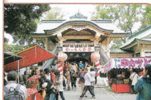
①参拝者と多くの露店で賑わう

「カッチン玉」と呼ばれるへの緒をかたどった飴が売り出され、安産・生育のご加護を得ようと多くの参拝客が訪れる。境内には100軒以上の露店が連なり賑わいを見せる。●名古屋市東区矢田南1-6-37 六所神社 ●地下鉄名城線ナゴヤドーム前矢田駅2番出口から徒歩11分 ●各種祈禱料5000円 ●9~17時 ●5台